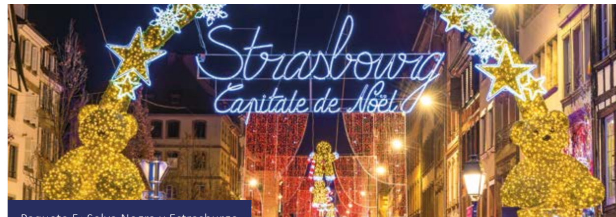
Paquete 5: Selva Negra y Estrasburgo

Si hay suficiente tiempo, puede visitar opcionalmente el mercado de Navidad en Esslingen, famoso por ofrecer un ambiente medieval muy especial. Traslado privado opcional al aeropuerto.