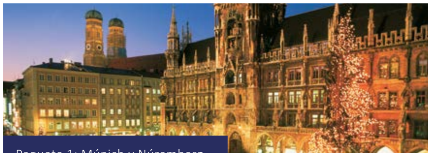
Paquete 1: Múnich y Núremberg