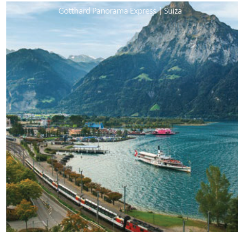
Gotthard Panorama Express | Suiza